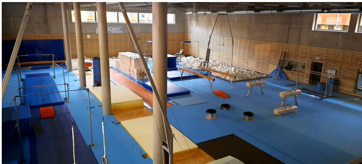
Gymnastická hala v Areálu sportovních nadějí